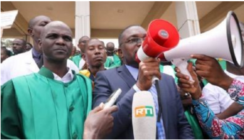
Figures 1 : série d'images illustrant la « marche verte » des enseignants-chercheurs et chercheurs à l'Université Félix Houphouët-Boigny à Abidjan